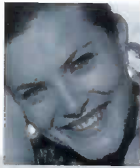
Emilie Pictet (soprano)